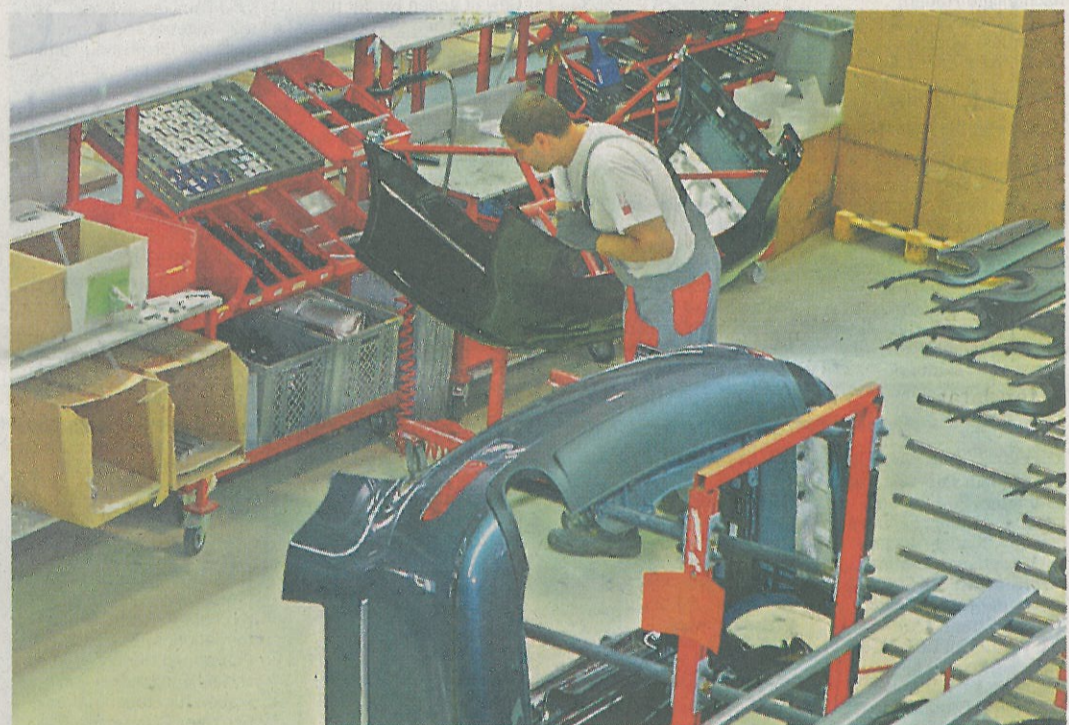
Seit 25 Jahren ist MS Design ein wertvoller Teil der Autoindustrie. Nach umfangreichen Investitionen verfügt die Firma in Roppen jetzt über die modernsten Produktionsanlagen im Kleinserienbereich.

MS Design produziert nicht nur die Kunststoffteile (Stoßfänger, Seitenschweller, Heckspoiler, Verkleidungen) selbst, sondern veredelt auch die Oberflächen und lackiert sie. Santer: „Die Stärken von MS Design sind 25 Jahre Erfahrung in der Automobilbranche. Wir liefern unseren Kunden Komplettlösungen – von der Vision bis zum fertigen Produkt. MS Design ist damit ein wertvoller Systemlieferant.“