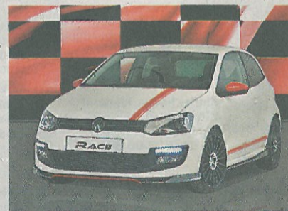
MS Design produziert Teile für spezielle Kleinserien bzw. sportliche Adaptierungen von Automodellen für VW, Audi, Porsche, Fiat, Hyundai und seit kurzem auch für Renault.